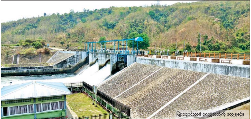
ဖြူးချောင်းတံခံ ရေလှည့်ဆည်ကို တွေ့ရစဉ်။

“ကျွန်တော်တို့ ဖြူးချောင်းရေလှောင်တံခံက ဒီနှစ်နေရာသီမှာတော့ နွေစပါးအတွက် စိုက်ပျိုးရေးပေးဝေနေပါတယ်။ စုစုပေါင်း နွေစပါးစိုက်ဧက ၁၈၀၀၀ အတွက်ဖြစ်ပါတယ်။ စီမံကိန်းရဲ့ သုံးပုံတစ်ပုံပါ။ စီမံကိန်းအားလုံးပြီးသွားရင်တော့ ဧက