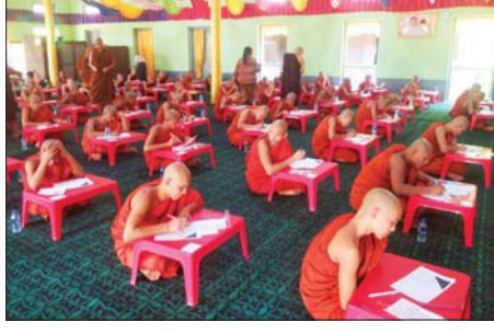
ထွန်းထွန်းစော်(ပြန်/ဆက်)

ဦးစီးမှူးရုံးတွင် ဆရာတော်၊ အရာရှိ ဦးတင်ထွန်းအောင်နှင့် ဇနီး၊ မီးသတ်တပ်ဖွဲ့ဝင်များ၊ မိသားစုဝင်များက ရေစက်ချ တရားတော်နာယူခဲ့ကြပြီး ဆရာ တော်များအား ဆန်းဆီဆေး၊ နှင့် ဝတ္ထုငွေများ ဆက်ကပ်လှူဒါန်း ခဲ့ကြောင်း သိရသည်။ (အပေါ်ပုံ) မြို့နယ်မီးသတ်ဦးစီးမှူး၊ ဦးစီး မြင့်မြင့်ရှိ