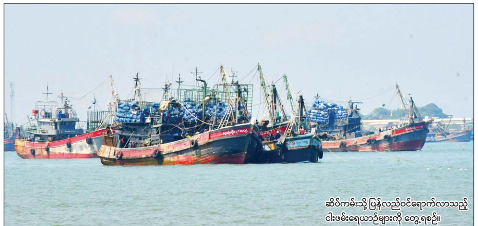
ဆိပ်ကမ်းသို့ ပြန်လည်ဝင်ရောက်လာသည့် ငါးဖမ်းရေယာဉ်များကို တွေ့ရစဉ်။

စောင့်ကြည့်လျက်ရှိရာ ယနေ့တွင် ပင်လယ်ပြင်၌ ငါးဖမ်းလေ့များ ပြန်လည်ဝင်ရောက်လျက်ရှိကြောင်း သိရသည်။ ငါးမဖမ်းရကာလ၊ ငါးမဖမ်းရဧရိယာများ သတ်မှတ်ဆောင်ရွက်ခြင်း သည် ငါးပွားပေါက်ပွားနိုင်သည့် ရာသီတွင် ငါးနှင့်သက်ရှိသယံဇာတများ ထိန်းသိမ်းနိုင်ရန် သုတေသနရလဒ်များဖြင့်ဆောင်ရွက်ခြင်းဖြစ်ကာ တနင်္သာရီ ကမ်းရိုးတန်းပင်လယ်ရေပြင်၏ ငါးနှင့်ငါးနေထိုင်ကျက်စား သည့် ရေအောက်စီပေဒေအခြေအနေများနှင့် မြန်မာ့ငါးလုပ်ငန်းရေးပြင် အတွင်း ငါးသယံဇာတများ ရေရှည်တည်တံ့စွာ တည်ရှိစေရန် သုတေသန ပညာရှင်များဖြင့် သုတေသနလုပ်ငန်းကို ဖေဖော်ဝါရီတွင် စီတင် ၂၀ အောက် တနင်္သာရီကမ်းရိုးတန်းရေပြင်၌ ရက်ပေါင်း ၃၀ ကြာ ငါး သယံဇာတ သုတေသနပြုလုပ်ငန်းများ ဆောင်ရွက်ခဲ့ကြပြီးဖြစ်သည်။