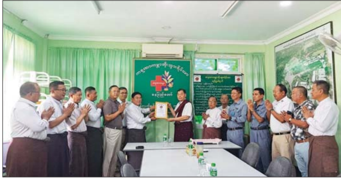
စစ်တက္ကသိုလ် အမှတ်စဉ်(၂၉) ၏ (၃၈) နှစ်မြောက် ကျောင်းဆင်းနှစ်ပတ်လည်နေ့ အထိမ်းအမှတ်အဖြစ် ဧပြီ ၁ ရက်က နေပြည်တော်ရှိ ကရုဏာကမ္ဘာတိုးတိုးဘေးရိပ်သာတွင် တစ်ရက်စာ အာဟာရဒါနှင့် ငွေပဒေသာ ပင် စိုက်ထူခြင်းအတွက် ငွေကျပ် ၂၅ သိန်း ပေးအပ်လှူဒါန်းစဉ်။ သတင်းစဉ်