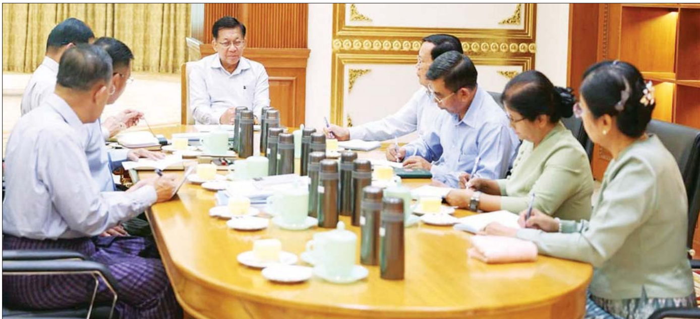
ပြည်ထောင်စုသမ္မတမြန်မာနိုင်ငံတော် ယာယီသမ္မတ နိုင်ငံတော်လုံခြုံရေးနှင့် အေးချမ်းသာယာရေးကော်မရှင်ဥက္ကဋ္ဌ ဗိုလ်ချုပ်မှူးကြီး မင်းအောင်လှိုင် စက်သုံးဆီများဖူလုံစွာရရှိရေးနှင့် စိုက်ပျိုးရေးလုပ်ငန်းများအတွက် လိုအပ်သည့်ဓာတ်မြေဩဇာများ လုံလောက်စွာရရှိရေးအစည်းအဝေးတွင် အမှာစကားပြောကြားစဉ်။